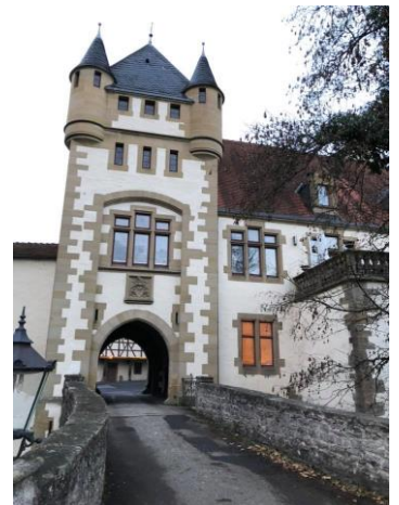
Götzenburg in Jagsthausen

Was für ein schönes Adventsgeschenk. Danke für die große Unterstützung!